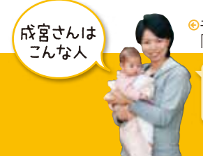
成宮さんは こんな人