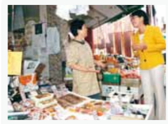
▲「お客さんふやしたいですね」と商店街で対話